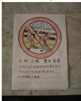
<走るの禁止の標識例>

5年生の児童は、言語数理運用科の学習成果を標識ポスターにまとめました。今後、校舎内に掲示されます。よ〜く見て、その大切さを想像し、行動に表していきましょう。