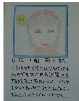
<笑顔をすすめる標識例>